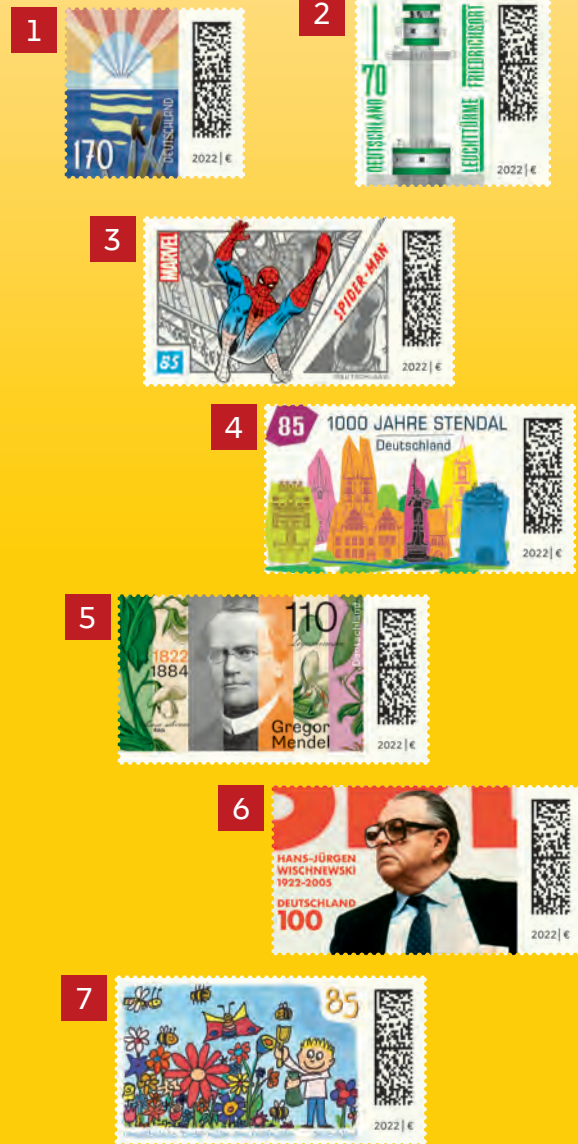
Alle Abb. Muster.